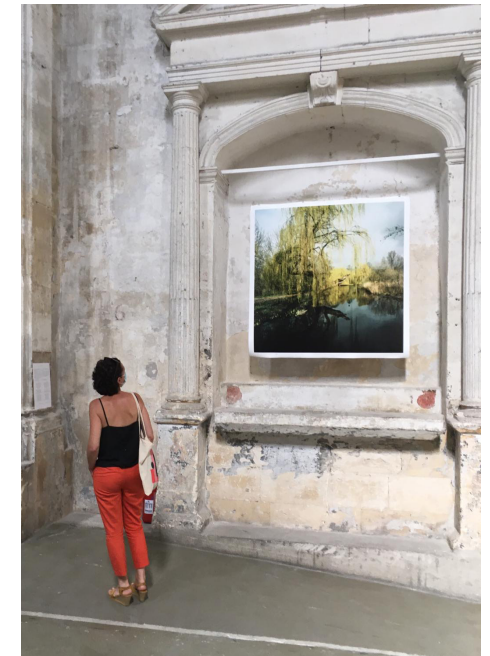
Exposition à la Chapelle des Trinitaires - Arles 2020

Cet ensemble d'images est inspiré du poème Hymne parmi les ruines d'Octavio Paz.